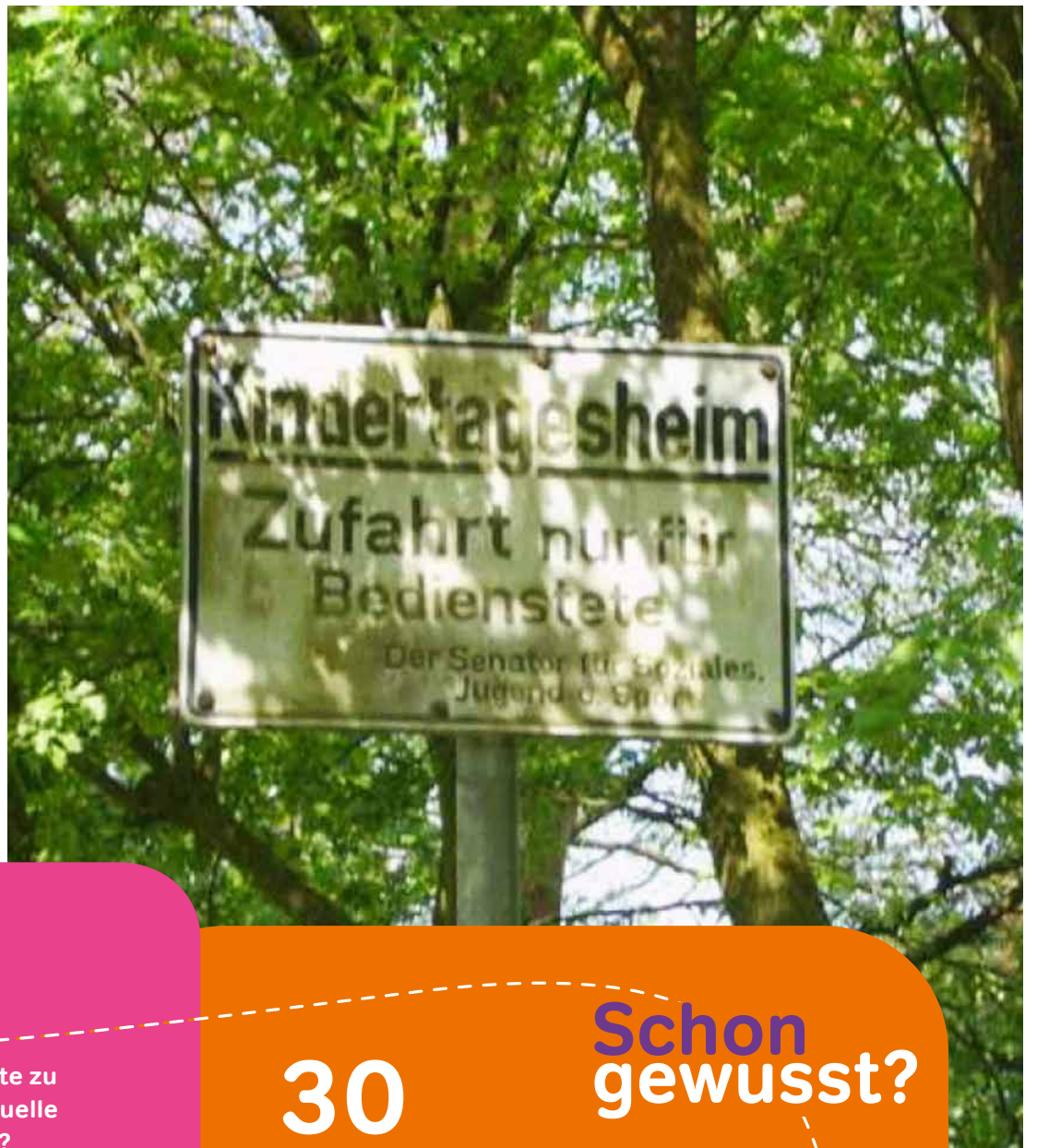
Foto: Zufahrtsschild des Kinder- und Familienzentrums Filtekramp 2009.

Erfahren Sie mehr über das Selbstverständnis und die Aufgabenbereiche von KiTa Bremen unter: www.kita.bremen.de/unserbetrieb